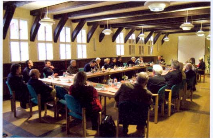
Kolloquium im Saal des Stolberger Rathauses.

Die Ausstellung beschäftigt sich mit Themen wie „Wirrisnis und Anarchie – Zwischen ‚Franzgold‘ und Reform“. Obwohl der Reichstaler in der ersten Hälfte des 17. Jahrhunderts seine eigentliche Bedeutung als Speziesmünze, also als ausgeprägte Währungsmünze verloren hatte, blieb er trotz mehrfacher Veränderung Rechnungsgrundlage. Großsilbergepräge waren selten. Gold erhielt durch Importe aus Brasilien wieder mehr Bedeutung. Es floß über Portugal nach Großbritannien und von dort direkt oder über Frankreich, häufig als geprägter Louis d'or (bewertet zu 5 Talern), nach Deutschland. Die Misere der auf Silber beruhenden Währungen in Deutschland machte spätestens zur Jahrhundertmitte einschneidende Reformen notwendig. Inzwischen war im Norden der Leipziger Rechnungstaler zwar die Grundlage aller Preise und Berechnungen, an der Berliner Börse wurden aber um 1740 alle Werte in französischer Währung notiert. Französische Louis blanc, seit 1726 Laubtaler waren wichtige Großsilbermünzen in Mitteleuropa. Der Harz mit seinem Silberreichtum bot für Niedersachsen und Mitteldeutschland eine Möglichkeit zur Prägung von Fein-