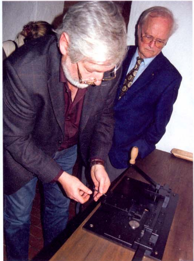
Präsentation der neuen Rändelmaschine, Funktionsmodell nach dem Original von 1763.